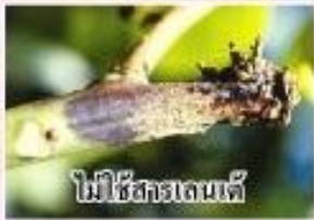
ไม่ใช้สารเลนเต้

ชื่อสามัญ : โพรคลอราซ (Prochloraz).....45% EC. กลุ่มสาร : อิมิดาโซล (Imidazole) คุณสมบัติ : ป้องกันและกำจัดโรคแอนแทรคโนสของมะม่วง