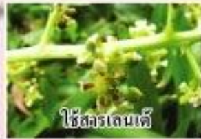
ใช้สารเลนเต้