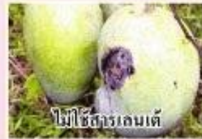
ไม่ใช้สารเลนเต้