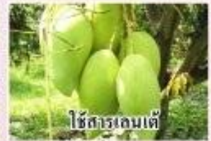
ใช้สารเลนเต้